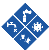
生物和健康致灾因子