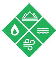
自然致灾因子和气候变化引起的致灾因子

许多方法被用于描述致灾因子和风险,如经济、环境、地缘政治、社会或技术。教育部门发现,采用涵盖了自然、技术、生物、健康、冲突、暴力和日常致灾因子的全灾种方法,有利于提升学校安全和韧性。